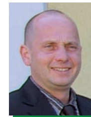
Karl Holzweber Wirtschaftshof