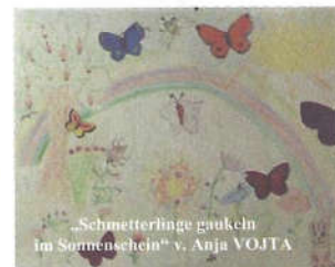
„Schmetterlinge gaukeln im Sonnenschein“ v. Anja VOJTA