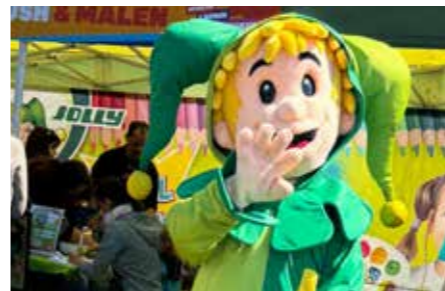
Vor dem Jolly-Zelt