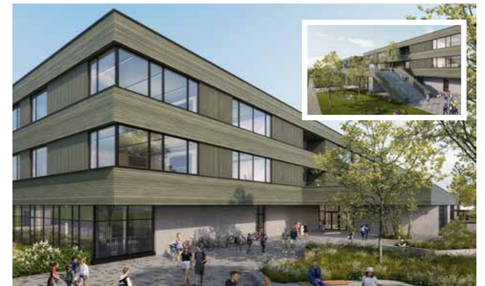
AHS Gerasdorf bei Wien (Grafik: © MEGATABS ZT GmbH)

■ Wachsende Bevölkerungszahlen und steigender Bedarf an Ausbildungsplätzen sowie die Entlastung umliegender Gymnasien machen den neuen Standort notwendig. Die BIG übernimmt das Projektmanagement. Die AHS wird