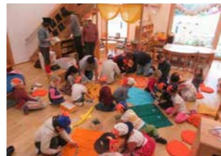
Mitmach-Theater im Kindergarten Kapellerfeld

■ „Geh mit uns“ ist fest in der Region verankert und öffnet regelmäßig seine Türen für die Öffentlichkeit. Märkte, Veranstaltungen und Projekte bieten die Möglichkeit, die Arbeit des Vereins kennenzulernen und mit den Menschen dahinter ins Gespräch zu kommen. Jeden Mittwoch um 09:00 gibt es einen großen Morgenkreis mit Kaffee und Kuchen - offen für Gäste! So wird Inklusion sichtbar und erlebbar – als selbstverständlicher Teil des gesellschaftlichen Lebens.