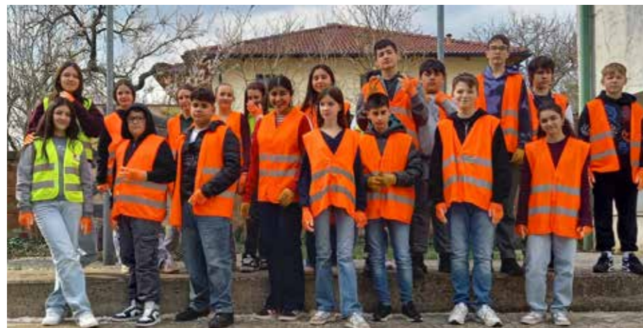
Danke an die 3. Klassen der Niederösterreichische Mittelschule