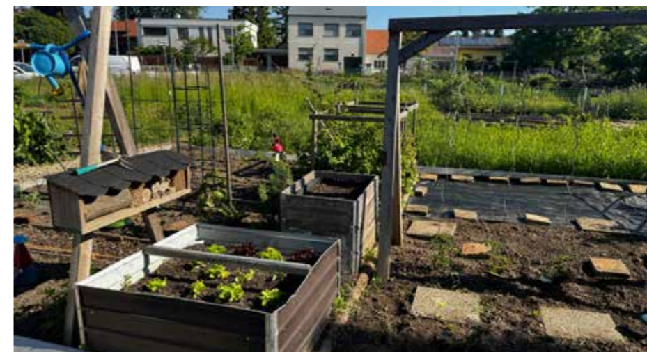
Urban Gardening: In der Dr.-Bruno-Simlinger-G. gibt es derzeit mehrere freie Parzellen

■ Sie möchten gerne eigenes Gemüse, Kräuter, Blumen oder Obst anbauen, haben aber keinen Garten? Dann ist das Urban-Gardening-Projekt der Stadtgemeinde Gerasdorf bei Wien genau das Richtige für Sie!