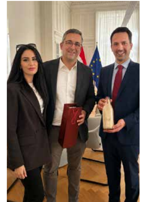
GRin Julia Ruf und Bgm. Dietmar Ruf mit Bildungsminister Christoph Wiederkehr

■ Der Besuch unterstreicht die Bedeutung eines kontinuierlichen Dialogs zwischen Gemeinde und Bundesebene. So können zentrale Bildungsprojekte vorangebracht und langfristig gute Rahmenbedingungen für Kinder und Jugendliche in Gerasdorf geschaffen werden.