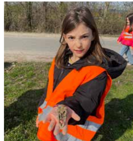
Ein besonderer Fund einer Schülerin