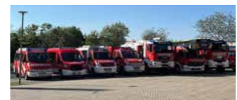
Feuerwehrautos der FF Gerasdorf

Die Feuerwehr Gerasdorf bedankt sich bei allen Teilnehmern für den zahlreichen Besuch! Besonderen Dank möchten wir auch unseren Partnerinnen aussprechen, ohne deren Unterstützung die Festlichkeiten in dieser Form nicht stattfinden könnten!