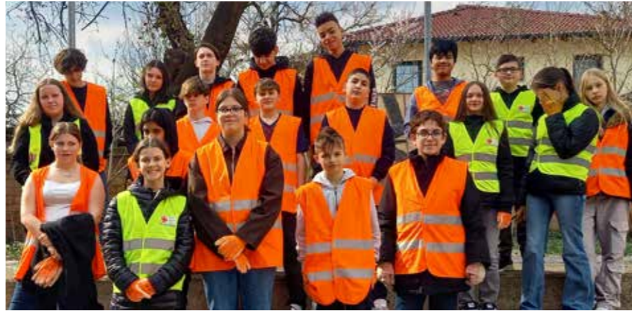
Danke an die 3. Klassen der Niederösterreichische Mittelschule

■ Vielen Dank an alle, die mitgeholfen haben, den achtlos weggeworfenen Abfall entlang von Straßen und öffentlichen Grünflächen einzusammeln. Mit ihrem Einsatz tragen sie maßgeblich dazu bei, die Lebensqualität in unserer Stadt nachhaltig zu sichern.