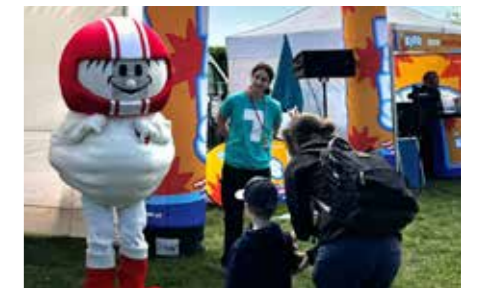
Starttreff mit TV-Helden wie z.B. Helmi

■ Danke an alle Besucherinnen und Besucher für diesen großartigen Familien Nachmittag!