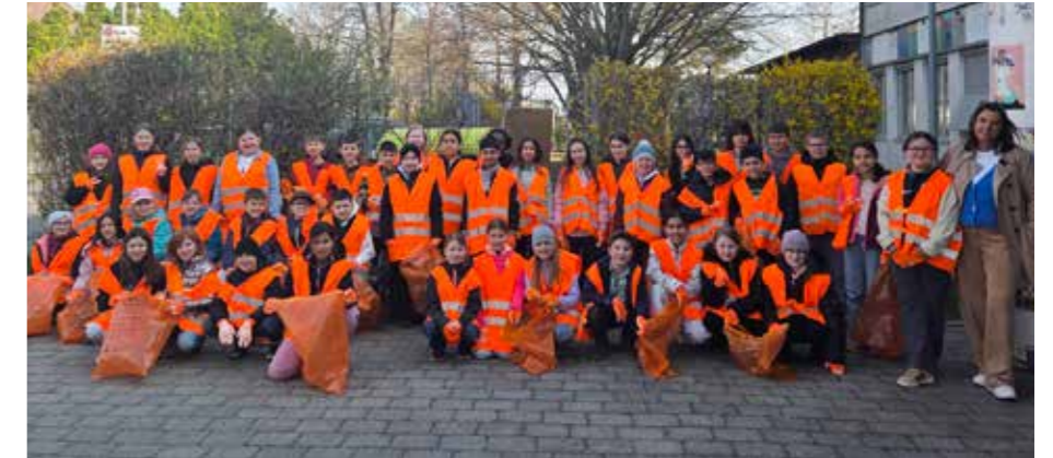
Danke an die VS Oberlisse

■ Für das leibliche Wohl der tüchtigen Helfer wurde auch wieder gesorgt, was Kraft und Energie für die Sammeltätigkeit gegeben hat.