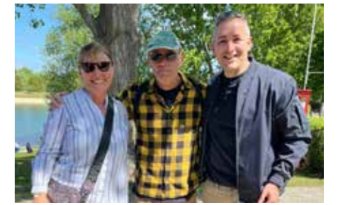
Internationale Gäste aus Australien