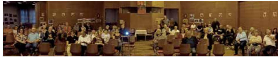
Präsentation am 7. Mai in der Kapellerfelder Kirche

■ Fotoausstellung Nachlese: Am 7. Mai um 18:00 kamen 60 bis 70 Personen in unsere Kapellerfelder Kirche. Die Wände waren gepflastert mit Fotos aus 100 Jahren Kapellerfelder Geschichte. Und eine Präsentation mit 153 Folien schenkte uns eine Zeitreise durch diese 100 Jahre. Für die Alteingesessenen unter uns waren es Erinnerungen an damals, als vor und nach dem Zweiten Weltkrieg die Siedlung aufgebaut und ausgebaut wurde.