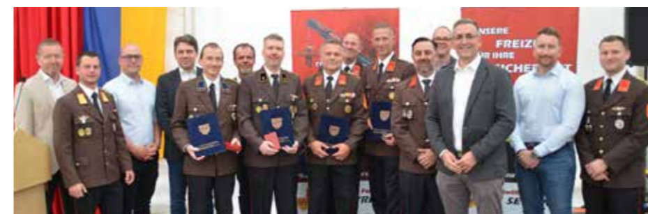
Vertreter der Stadtgemeinde bei der Überreichung der Ehrungen und Auszeichnungen.

■ Am Sonntag, 10.05.2026 startete das Schnitzel-Frühschoppen mit vielfältigem Unterhaltungsprogramm für Groß und Klein, darunter Feuerwehraktionen und eine Tombola mit attraktiven Preisen.