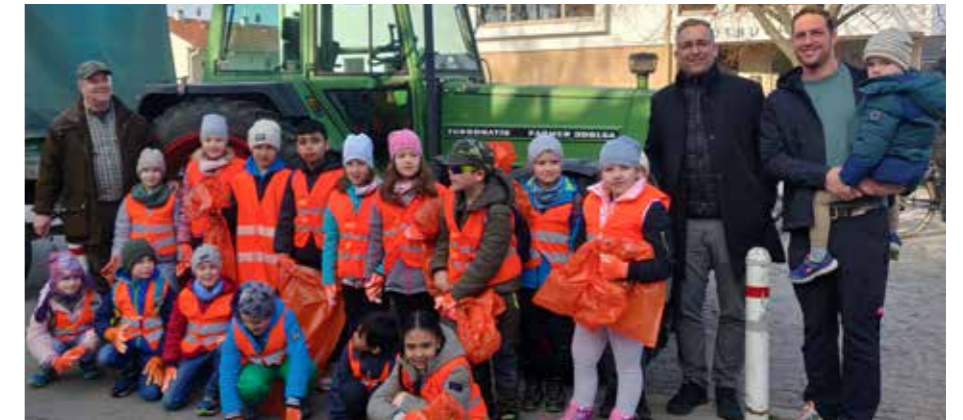
Danke an die VS Oberlisse