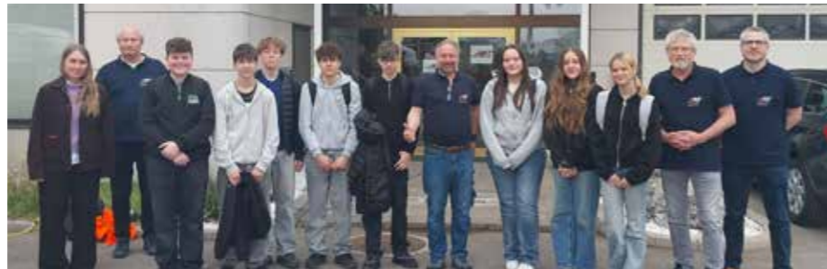
Berufsorientierung: Lehrausgang bei ARtec & Rail Transport GmbH und AUSTRIAN RAIL TEAM

■ Den Abschluss des Lehrausgangs bildete eine Besichtigung des alten Lokbahnhofs Süßenbrunn. Mit