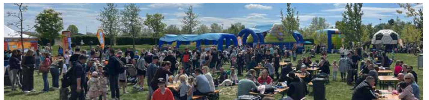
Sehr gut besucht: Bei den verschiedenen Stationen bildeten sich lange Schlangen