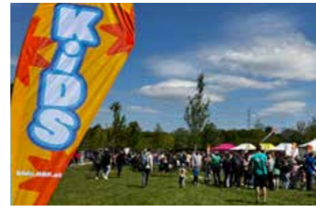
Viel los am Badeteich-Gelände

Spiel & Spaß | Am 1. Mai herrschte riesiger Andrang bei den zahlreichen Attraktionen