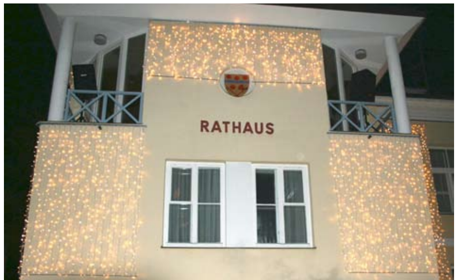
Die neue Weihnachtsbeleuchtung für das Rathaus Gerasdorf.