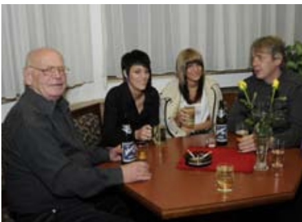
Familie Machoritsch: Stammgäste im VBH Oberlisse