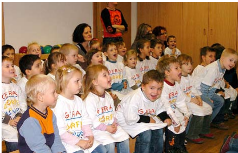
Fröhliche Kinder bei der Eröffnung.