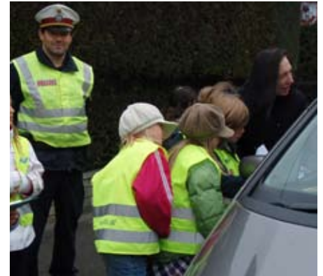
Die Polizei unterstützt die Aktion.

Der Reihe nach wurden die Kraftwagen angehalten und befragt. Hatte sich der Fahrer angeschnallt und war im vorgeschriebenen Tempo gefahren, so bekam er einen Apfel. War der Fahrer nicht angeschnallt oder auch noch zu schnell, so gab es eine Zitrone. Die Kinder hatten großen Spaß bei dieser Aktion und so mancher „Verkehrssünder“ wollte zukünftig langsamer sein oder sich anschnallen.