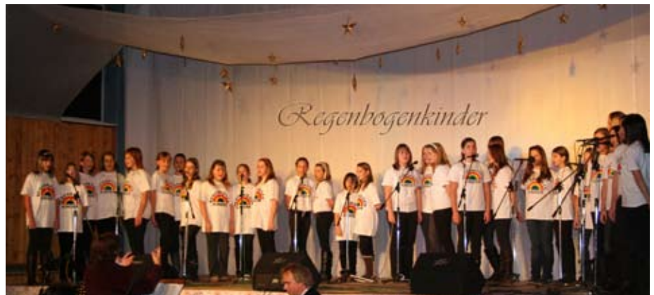
Weihnachtliche Lieder der Regenbogenkinder in der Hauptschule Gerasdorf.