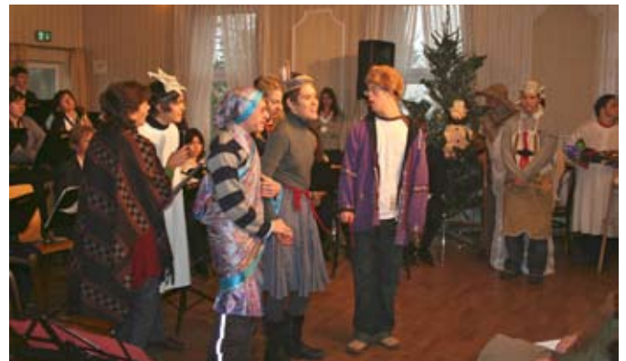
Ein Weihnachtslied mit Schützlingen v. Geh mit uns.