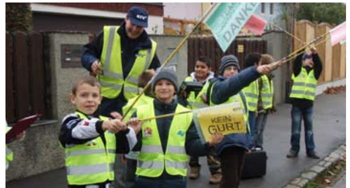
Grüne Fahnen für Einhaltung der Geschwindigkeit.