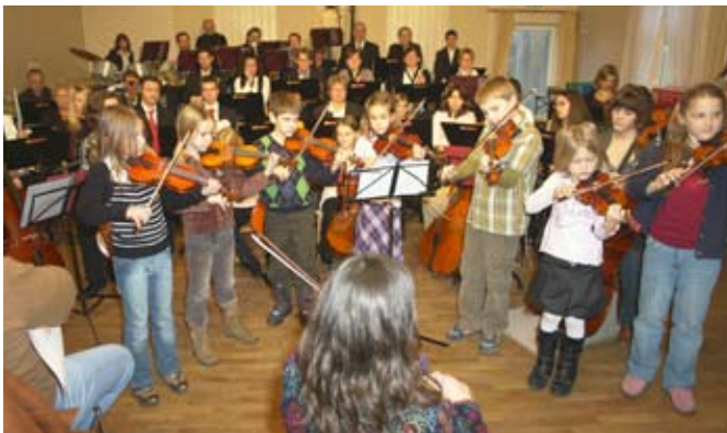
Die jüngsten Musikschüler .

Auch die Schützlinge von Geh mit uns sangen und spielten wieder ein Weihnachtslied.