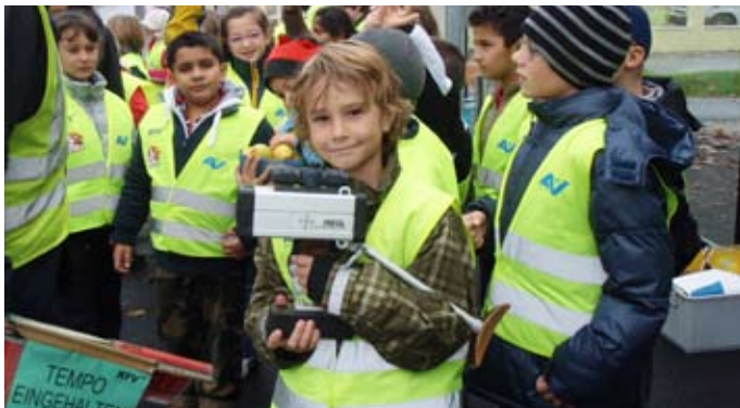
Kontrolle mit Geschwindigkeitsmesser