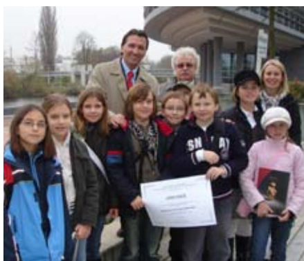
Die siegreichen Volksschüler mit Urkunde vor dem NÖ Landhaus.