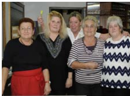
Die fleißige Damenrunde vom Verein Volksheim.