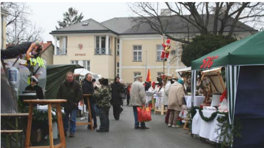
Der Adventmarkt in der Kirchengasse und vor dem Rathaus.