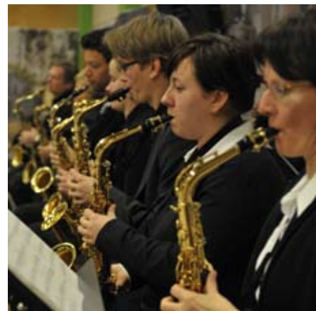
Die Musikschule bietet musikalische Höchstleistungen