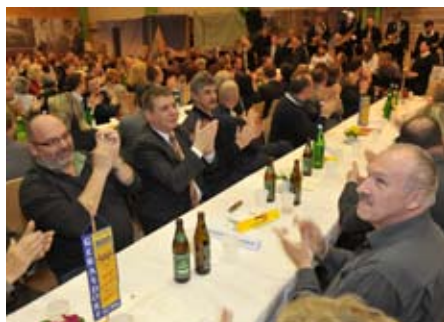
Applaus im vollen Saal bei der Begrüßung der Ehrengäste