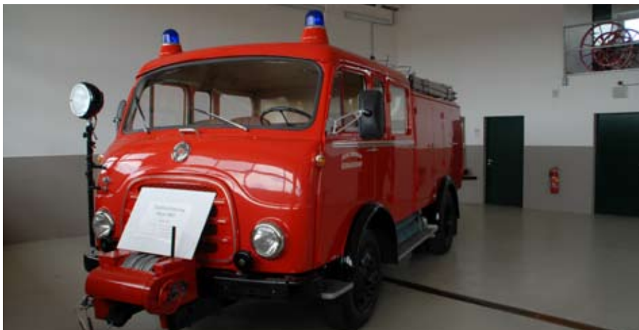
Steyr 680 Oldtimer, Bj. 1966. Heuer: 4 Feuerwehrautos, Bj. 2009