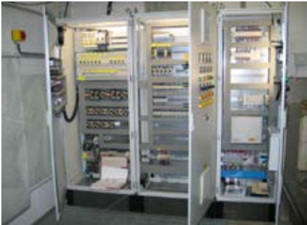
Die neuen Schaltschränke in Kapellerfeld/Sonnwendgasse.

■ Kapellerfeld: In der Pumpstation Sonnwendgasse wurde die elektrische Schaltanlage des Saugkanals auf den neuesten Stand der Technik gebracht. Mit der neuen Installation werden Fehler und Gebrechen im Kanalnetz vollautomatisch gemeldet. Alle Infos können von der Kanalbereitschaft der Gemeinde online am angeschlossenen PC abgefragt werden.