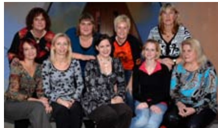
Das Team im KG Gerasdorf.

Gemeinde für die vorbildhafte Zusammenarbeit. Alle 4 Gruppen haben jetzt nach dem Zubau eine Sitzecke, in der der alltägliche Morgenkreis stattfinden kann.