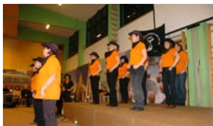
Die Linedance-Gruppe „The Chaperfields“ in Aktion