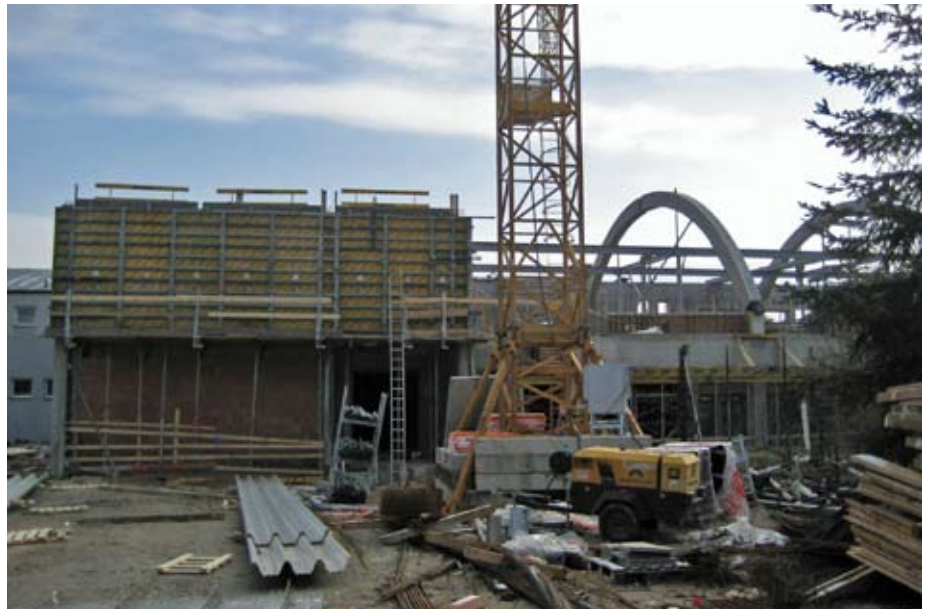
Bei der Volksschule Kapellerfeld ist der Baufortschritt sichtbar.

In Kapellerfeld wird die Investition durch einen großen Turnsaal mit Tribüne abgerundet. Dieser steht in Zukunft auch den vielen Turnvereinen zur Verfügung.