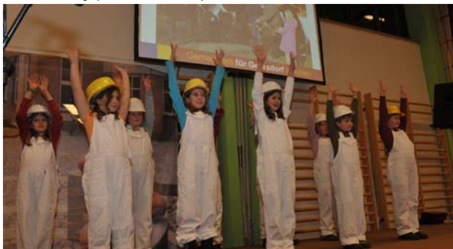
Die Dance-Fit-Fun Gruppe der Volksschule Oberlisse: Super!