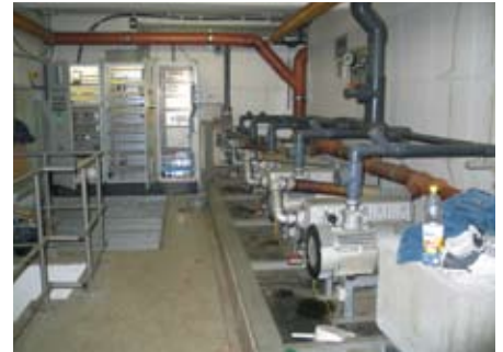
Die Elektronik und das Pumpwerk in der Kanalstation.

■ Kapellerfeld: In der Pumpstation Sonnwendgasse wurde die elektrische Schaltanlage des Saugkanals auf den neuesten Stand der Technik gebracht. Mit der neuen Installation werden Fehler und Gebrechen im Kanalnetz vollautomatisch gemeldet. Alle Infos können von der Kanalbereitschaft der Gemeinde online am angeschlossenen PC abgefragt werden.