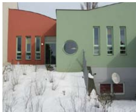
Viel Farbe beim Bau in Seyring

■ Der Zubau der 4. Gruppe im ersten Stock bedeutet mehr Platz für alle Kinder in den gemeinsamen Bereichen. Kuschecke und Bauecke kommen bei den Kindern sehr gut an. Der Raum für heilpädagog. Betreuung und die Küche im oberen Geschoß sind eine Entlastung für die Betreuerinnen. Der Hit ist die neue Kletterwand über dem Stiegenaufgang.