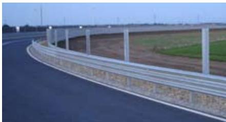
Straßen, Wege und Radwege

■ Mehr Infrastruktur bedeutet: Verbesserungen bei der Straßenbeleuchtung, bei Wegen und Radwegen, bei Teilen der Kanalsanierung und der Ortsbildgestaltung werden bereits 2009 durchgeführt, auch wenn sie erst für später geplant waren.