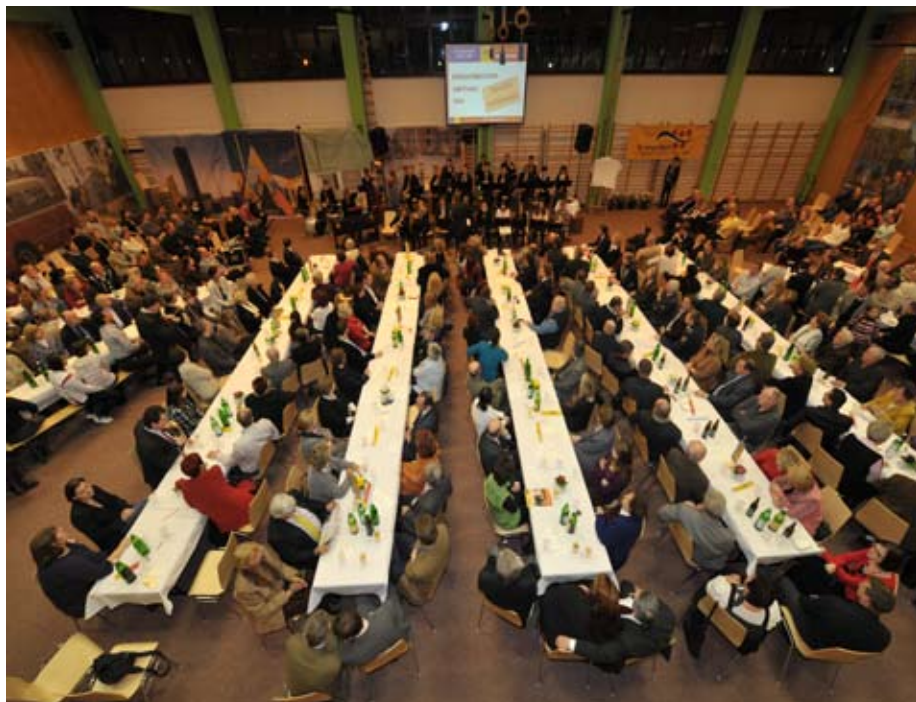
Der Turnsaal der Volksschule Seyring war zum Bersten voll.