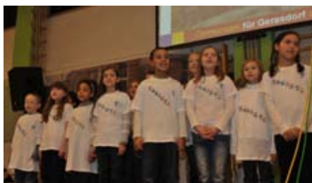
Der Chor der Volksschule Oberlisse begeistert das Publikum