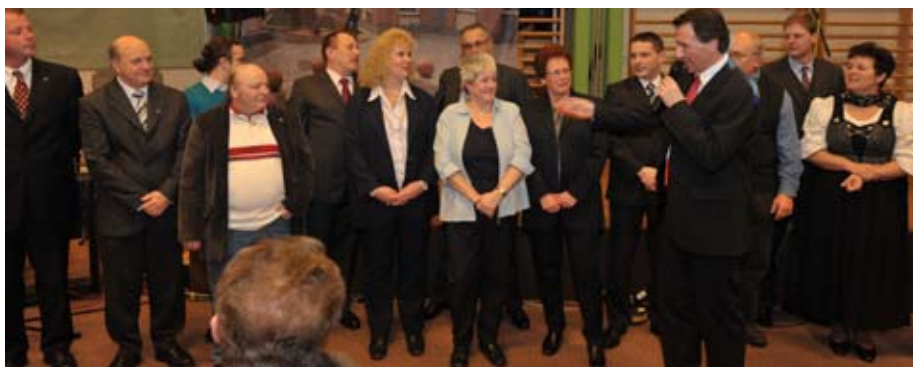
Der Gerasdorfer Gemeinderat als Team: alle anwesenden Stadträte und Gemeinderäte werden persönlich vorgestellt