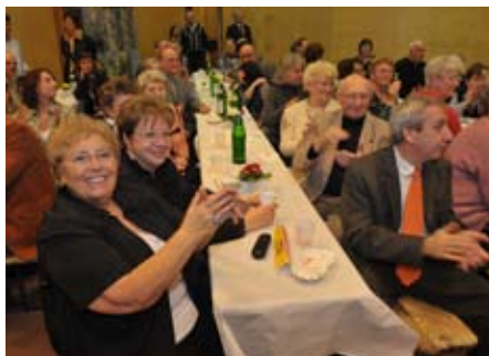
Applaus für die Darbietungen

Volksschule Seyring: Großer Andrang der GerasdorferInnen am 29. Jänner beim Bürgermeisterempfang. Bevölkerung und Ehrengäste feierten den Start zu 10 Jahre Stadt