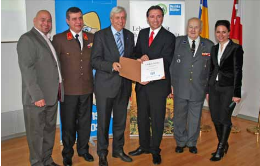
Die Gerasdorfer Delegation nimmt die Auszeichnung entgegen.

■ Über 325 GerasdorferInnen haben über das Bezirksblatt die eigene Gemeinde bewertet. Ergebnis: Vorzugszeugnis für die Wohlfühlgemeinde Gerasdorf mit einem Notendurchschnitt von 1,2 in insgesamt 10 Bewertungskategorien (siehe Artikel unten).