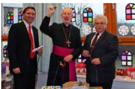
Weihbischof Franz Scharl segnet die neuen Räume.