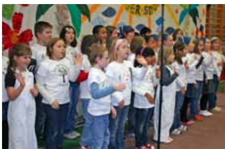
Der Chor mit „Unsere Schule feiert heute“.

■ Die Schüler/innen und Hortkinder zeigten ihr Können. Mit fröhlichen Liedern begrüßte der Chor der Schule, die GEKICOS, die Eltern und Besucher. Die Flötengruppe spielte die Europahymne und die Dance-Fit-Fun Gruppe setzte sich mit dem Thema Zubau in Tanzdarbietungen auseinander.