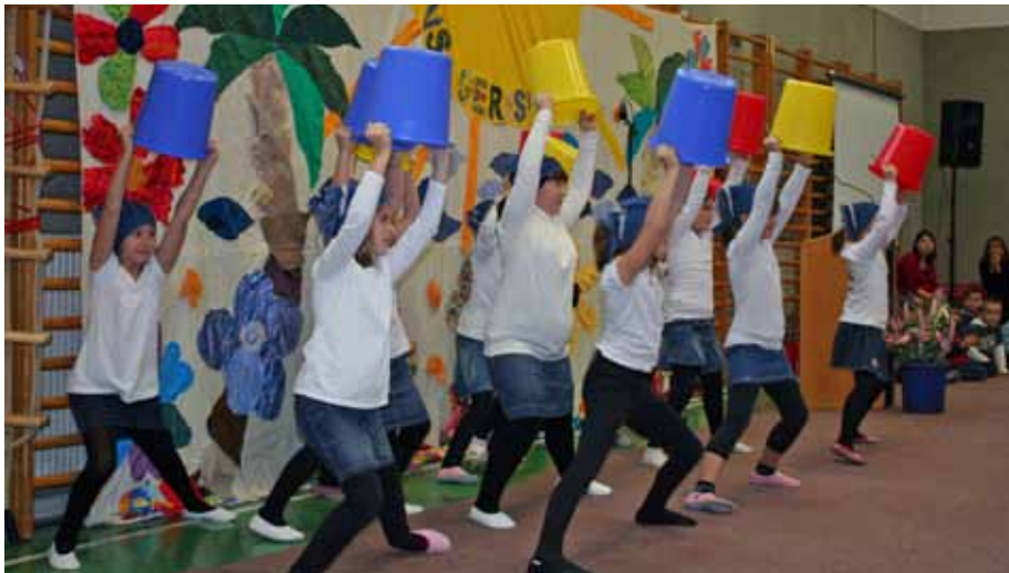
Die Dance-Fit-Fun Gruppe mit „heute wird bei uns geputzt“.