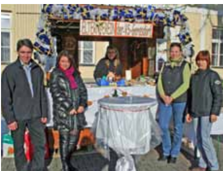
...Elternverein der VS Oberlisse,