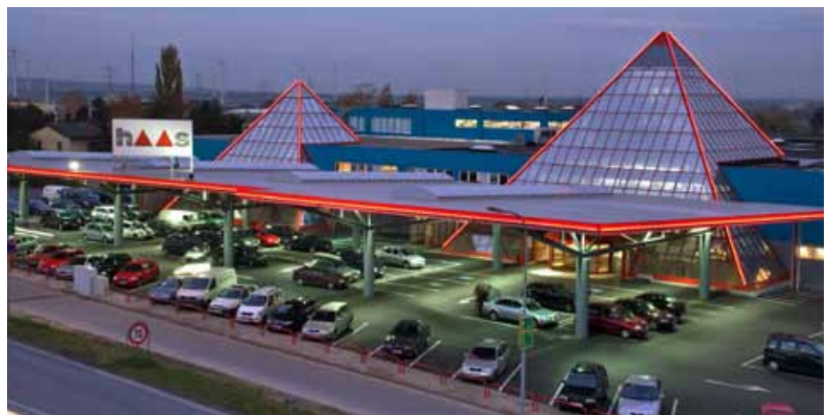
Die weithin sichtbaren Haas-Pyramiden an der Brünner Straße 160.