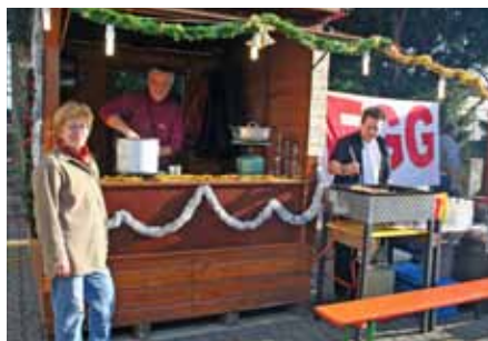
die Fahrgemeinschaft Gerasdorf...