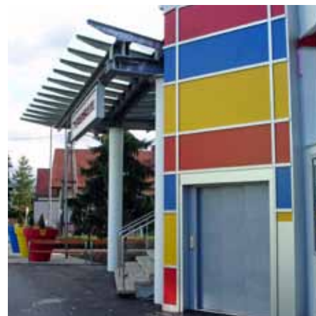
Der Lift hilft allen.

■ Die nächsten Veranstaltungen im Volksbildungshaus Oberlisse: 9. Jänner SPÖ Arbeiterball 16. Jänner Turnerkränzchen