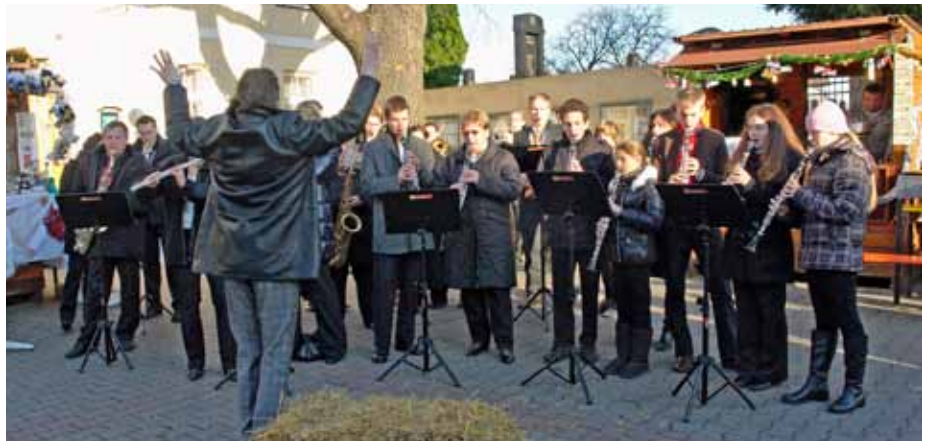
Die Eröffnung des 18. Gerasdorfer Adventmarktes durch Schüler der Musikschule Gerasdorf.