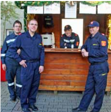
Mit dabei die FF Gerasdorf...