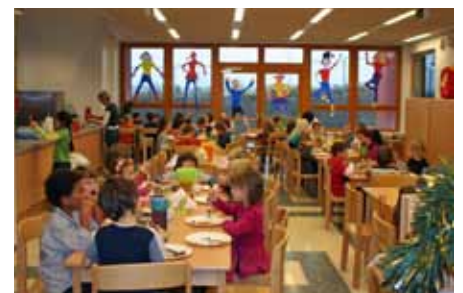
Der neue, große Speisesaal für die Hortkinder.

■ Eigene Räumlichkeiten für die Hortkinder. 4 zusätzliche Klassenzimmer, 1 Bewegungsraum und Horträume für 6 Hortgruppen mit Speisesaal, eigenem Eingang, Terrassen und Grünräumen entstanden innerhalb eines Jahres in ökologischer Bauweise mit moderner Be- und Entlüftungsanlage. Der Zubau kostete 3 Mio Euro.