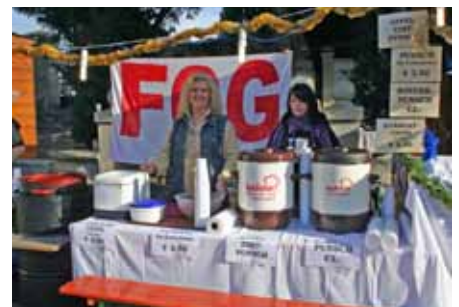
und der Hortverein Seyring.