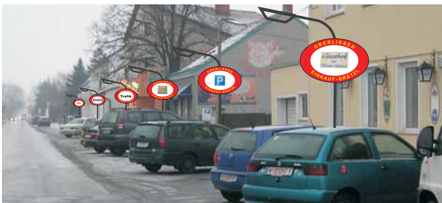
Optische ansprechende Gestaltung, mehr Licht und Sicherheit.

■ Neugestaltung für mehr Einkaufsvergnügen. Die für das Einkauf-Grätzl eingerichtete Arbeitsgruppe der Stadtgemeinde hat einen Plan ausgearbeitet, wonach mit einfachen Mitteln einige Verbesserungen bei den Geschäften rund um den Kreisverkehr in der Oberlisse möglich sind: Parkplatzmarkierungen, bessere Gehsteigbeleuchtung, einheitliche Beschilderung, eventuell ein Wochenmarkt mit zusätzlichen Produkten aus der Region.