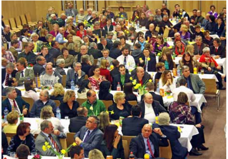
Der Turnsaal der Volksschule Kapellerfeld war voll besetzt.