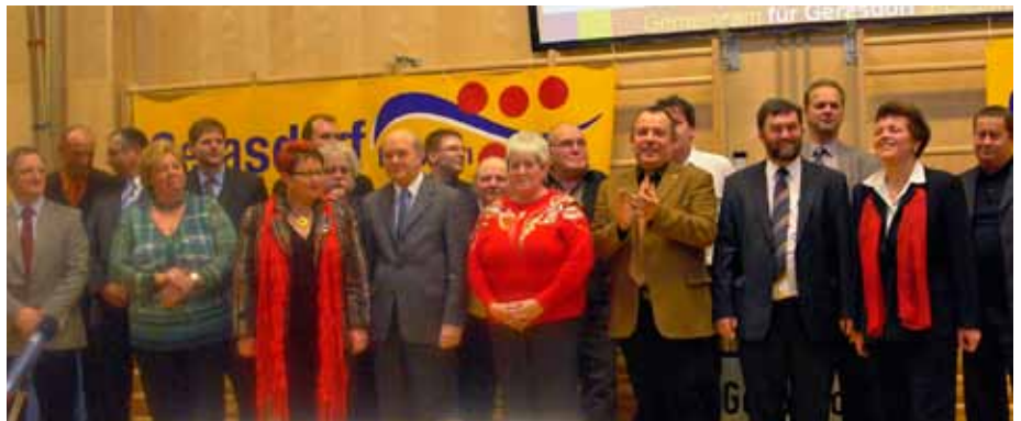
Der Gerasdorfer Gemeinderat als Team: alle anwesenden Stadträte und Gemeinderäte wurden persönlich vorgestellt.