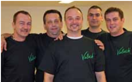
Das Team vom Gasthaus Va-luch sorgte für die Bewirtung.