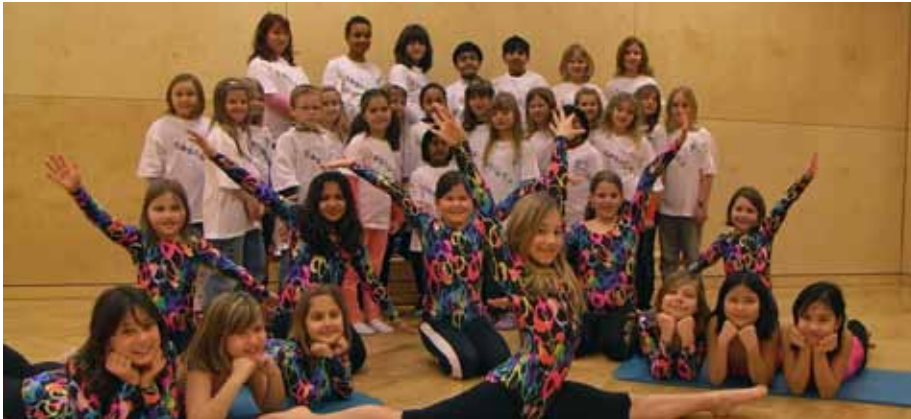
Die Gekicos und die Tanzgruppe der Volksschule Gerasdorf...