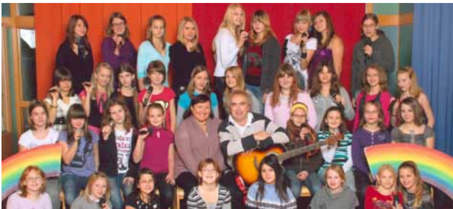
...und die Regenbogenkinder der HS vertreten Gerasdorf beim Bezirksjugendsingen am 23. März in der Körnerhalle in Schwechat.

■ Die Gekicos der Volksschule Gerasdorf, die Tanzgruppe der Volksschule Gerasdorf und die Regenbogenkinder der Hauptschule Gerasdorf freuen sich die Stadtgemeinde Gerasdorf bei Wien beim Bezirksjugendsingen am 23. März 2010 in der Körnerhalle in Schwechat vertreten zu dürfen.