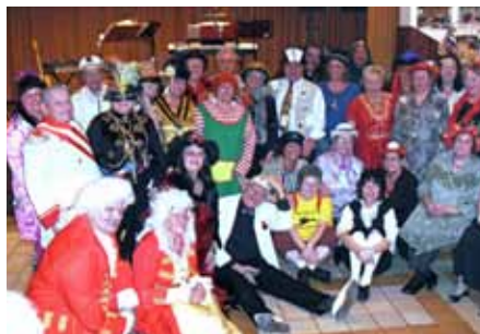
Faschingsfest der Pensionisten.

■ Anmeldung unter 02248/3825 oder herwig.souczek@aon.at