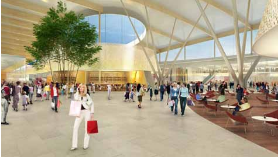
So wird das neue Einkaufszentrum aussehen: Hell und modern!