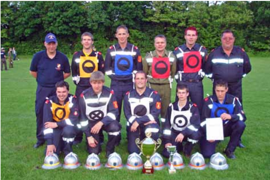
Die erfolgreiche Wettkampfgruppe der FF Seyring.