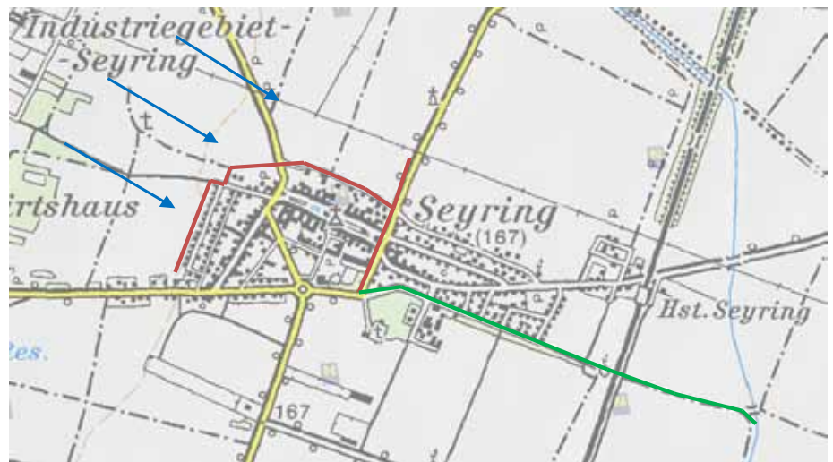
Blau: Strömungsrichtung Grundwasser. Rote Linie: Drainage. Grüne Linie: Neue Ableitung in den Abzugsgraben.

■ Die Ableitung erfolgt mit Kanalarohren und Pumpen mitten durch den Ort, unter der Schnellbahn durch und in den Abzugsgraben. Die finanzielle Förderung beträgt ca. 10% der Kosten.