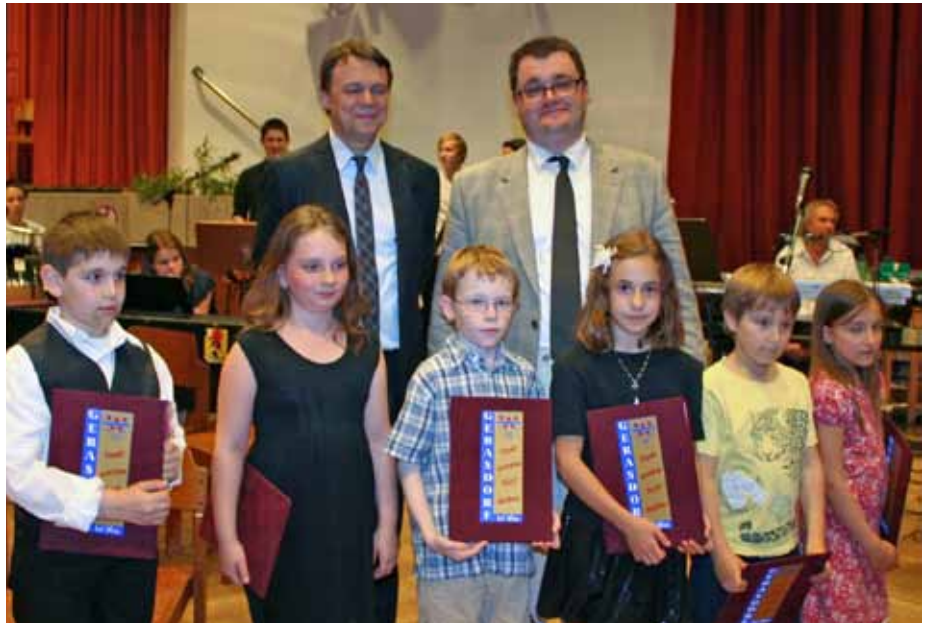
Die Preisträger von „Prima la Musica“ wurden ausgezeichnet.