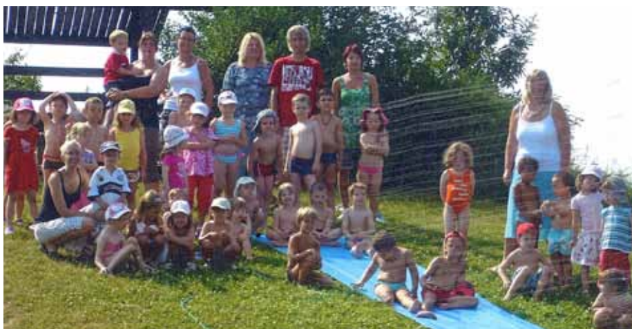
Ferienbetreuung im Kindergarten Gerasdorf, in der Kuhngasse.