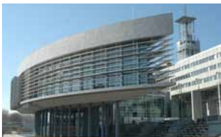
Bestes Einvernehmen mit dem Land NÖ in Finanzfragen.

■ Die Förderung gibt es für die Radrouten- und Radwegeprojekte im Rahmen der Dorf- und Stadterneuerung, die gerade in der Stadtgemeinde Gerasdorf bei Wien durchgeführt werden.