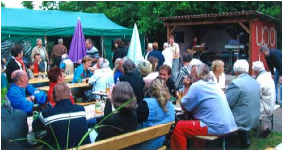
Frühlingsausklang am 20. 6. 2010 beim Siedlerverein Kapellerfeld.