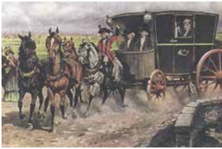
Abbildung 2: Kurs Wien-Brünn 1750. Kartenserie Postbeamtenverein Wien 1900

straße militärische Bedeutung, unter Hitler wurde sie ausgebaut, 1939 die Tschechoslowakei besetzt.