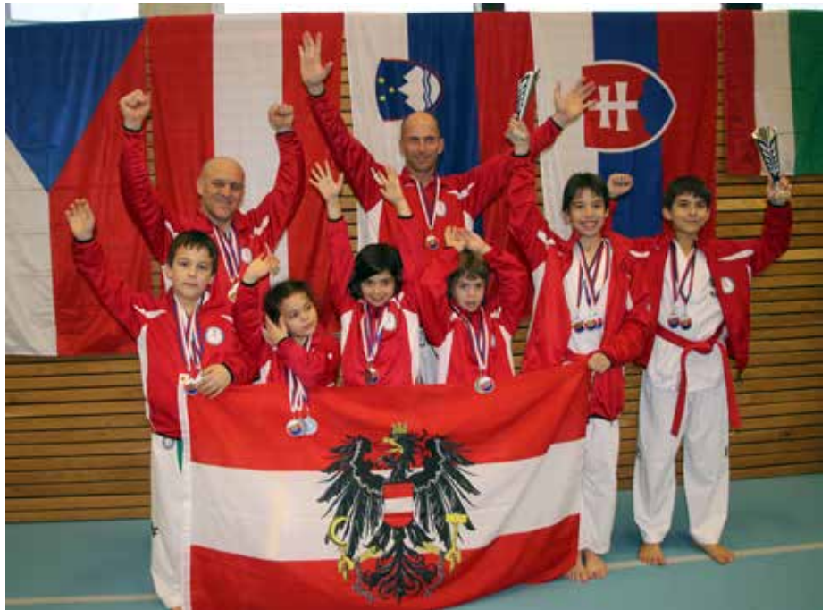
Das Team des Taekwon-Do Vereins Baekjul-Boolgool aus Föhrenhain bei den Czech Open 2017

■ Der internationale Blackbelt Cup hat auch 2017 wieder Me-