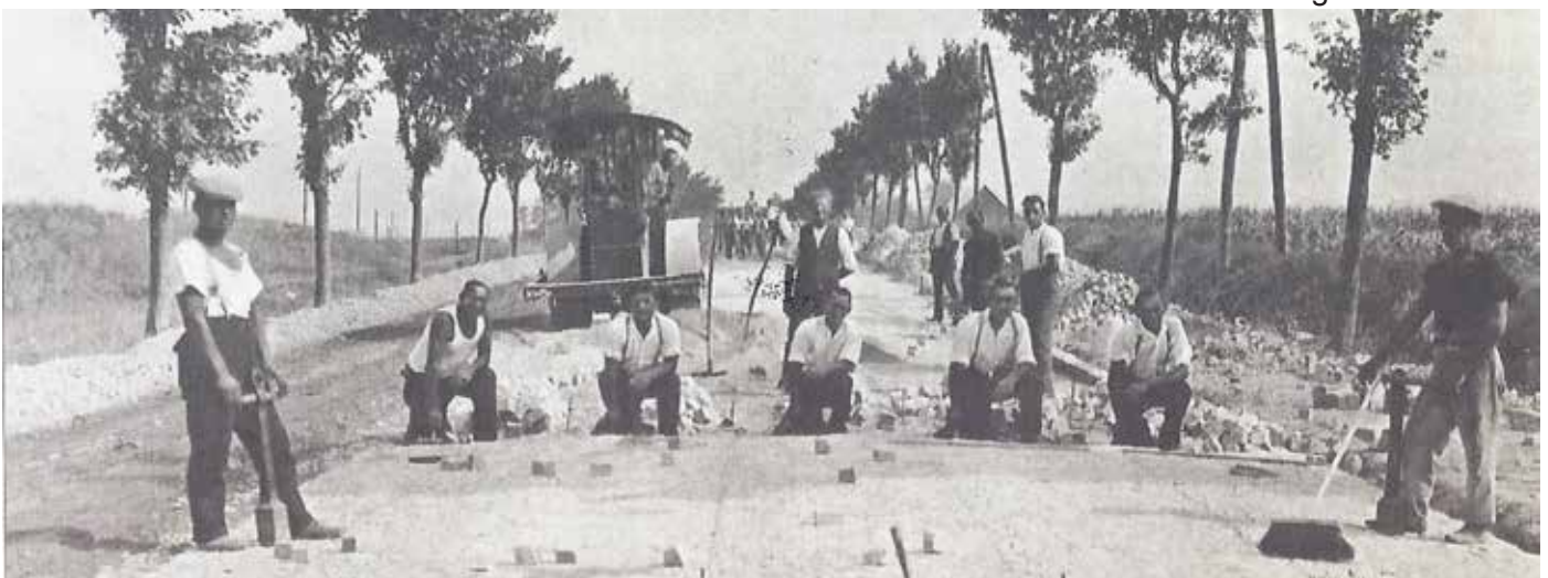
Abbildung 3: Pflasterarbeiten am Rendezvousberg 1926