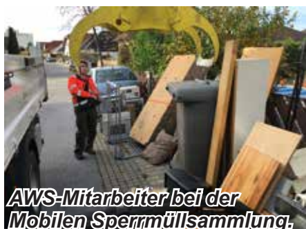
AWS-Mitarbeiter bei der Mobilien Sperrmüllsammlung.