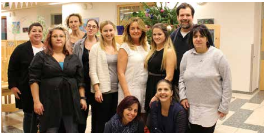
Das Team des Hortes Gerasdorf Oberlisse.