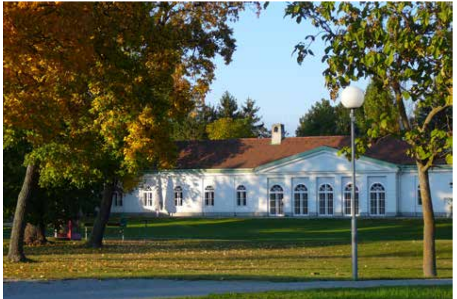
Die ehrenamtlichen Mitarbeiterinnen und Mitarbeiter der Bücherei freuen sich auf Ihren Besuch!

■ Zu diesem Anlass möchten wir in Erinnerung bringen, dass die Bücherei eine Stadtbücherei ist,