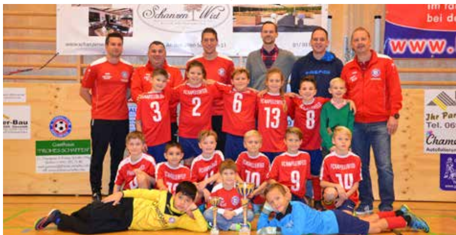
Die roten Teufel beim Schanzenwirt-Hallencup mit Gemeindevertretern und Sponsoren

■ Die Siegerehrungen begleiteten Vertreter der Gemeinde und der Sponsoren rund um das Schanzenwirt-Team, die den Kindern die Pokale bzw. Medaillen überreichen durften.