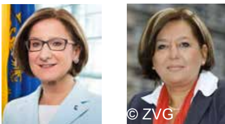
Der Dank geht an LH Mag. Johanna Miki-Leitner und LH-Stv. Karin Renner

Seitens des Landes Niederösterreichs wurden der Stadtgemeinde Gerasdorf bei Wien Bedarfzuweisungen in der Höhe von € 316.000 gewährt. Zu Jahresbeginn waren es zunächst €154.000. Jetzt wurde nochmals aufgrund unserer Ansuchen um € 162.000 nachgebessert. Ich sage im Namen der Stadtgemeinde herzlich: Danke!