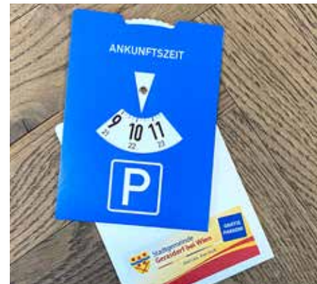
Parkscheiben wurden mit dem April-Gemeindekuriere an alle Haushalte verteilt