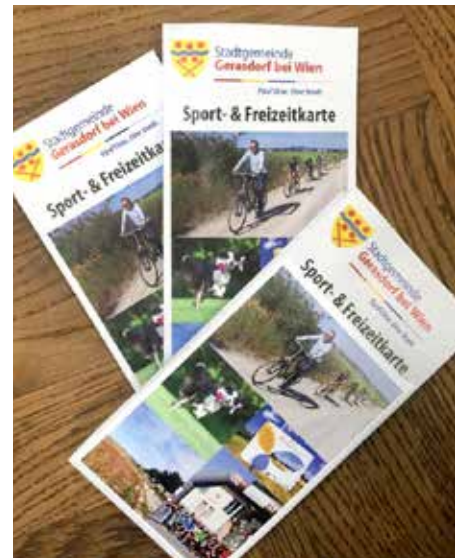
Die Sport- & Freizeitskarte ist kostenlos im Rathaus erhältlich.