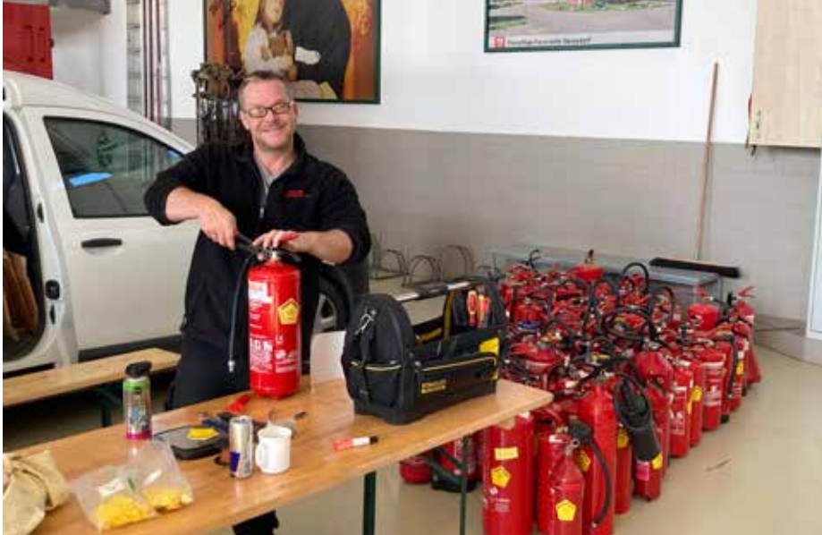
Eine tolle Aktion der FF Gerasdorf in Zusammenarbeit mit der Fa. Fire-Ex

■ Feuerlöscher müssen im Fall des Falles funktionieren und können nur dann ihre Aufgabe zuverlässig erfüllen, wenn sie entsprechend gewartet werden.