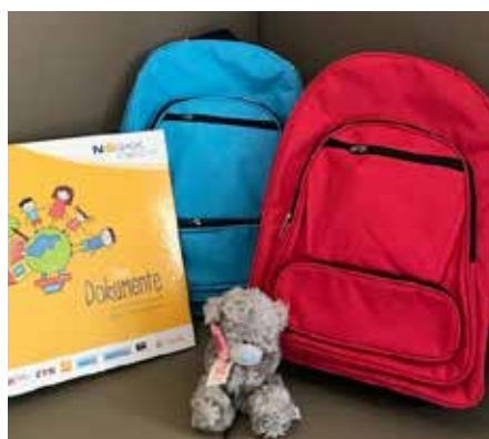
Wäschepaket für Neugeborene