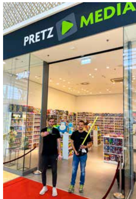
„Comic Con“-Feeling im Kompaktformat: Neuzugang Pretz Media begeistert im G3 Shopping Resort Gerasdorf mit einer großen Auswahl an Merchandise-Artikeln aus der Film- und Gamingwelt.

■ Wie sich bereits in den ersten Tagen nach der Eröffnung zeigt, werden nicht nur Harry Potter-Fans vom neuen Shop magisch angezogen. Einfach vorbeikommen und eintauchen in die spannende Welt von Darth Vader, Marvel & Co.