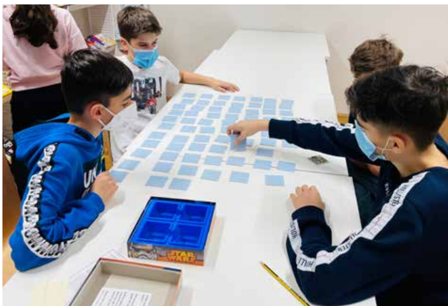
In der Spielothek warten über 300 Spiele auf die Kinder.

■ Lesevergnügen & Spielspaß: In der neuen Stadtbücherei in der Schulgasse stehen aktuell über 6.000 Bücher (inkl. Hörbücher) und mehr als 300 Spiele zum Entleihen bereit.