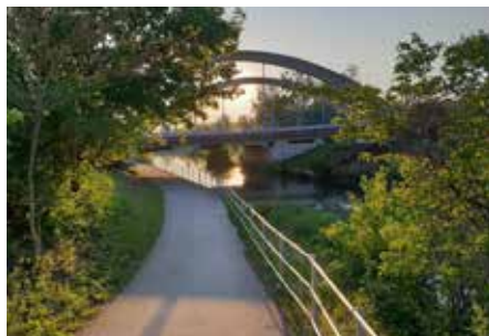
Abendstimmung am Marchfeldkanal