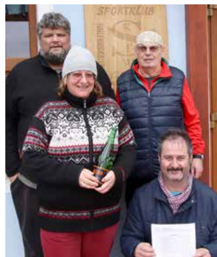
Gratulation an alle Gerasdorfer Stocksportler

■ Der ESV ASKÖ Gerasdorf konnte sieben Siege und drei Niederlagen verbuchen. Mit 14:6 Punkten konnte die Gerasdorfer Mannschaft glücklich und zufrieden den hervorragenden vierten Platz von elf Mannschaften in der Endergebnisliste belegen.