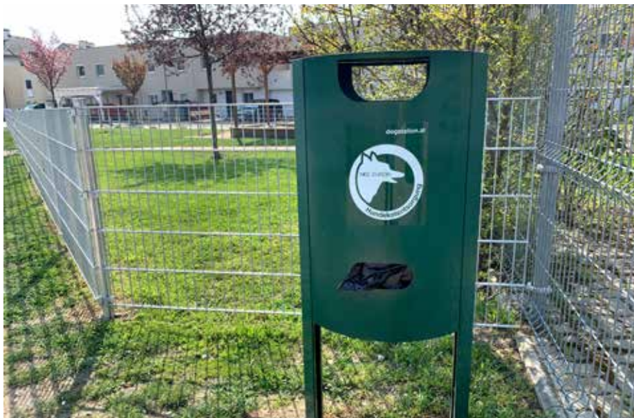
Insgesamt 43 Hundekotsackerlspender sind im Gerasdorfer Gemeindegebiet aufgestellt; Bsp.: Dr.-Erwin-Ringel-Platz

Umwelt | Bitte nutzen Sie die kostenlosen Hundekotsackerl