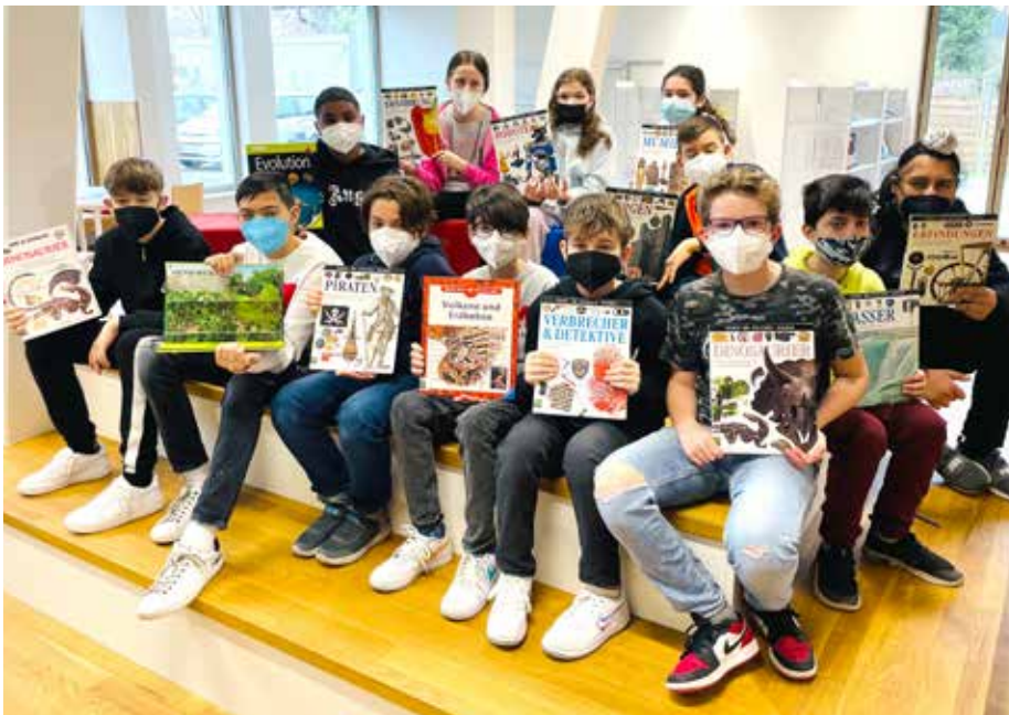
SchülerInnen der NÖ Mittelschule haben eine Rätselrallye in der neuen Stadtbücherei veranstaltet.

Spiel & Spaß | Eine Rätselrallye für die 2. Klassen der NÖ Mittelschule.