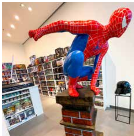
Egal ob Gaming, Comic oder Film, Pretz Media hat garantiert auch etwas für Sie parat.

■ Gaming- und Film-Fans aufgepasst: Der im G3 Shopping Resort Gerasdorf brandneu eröffnete Store von Pretz-Media hat es in sich! Auf insgesamt 80 m 2 erschließt sich dem Fan eine Abenteuer- und Fantasywelt voller faszinierender Merchandise-Artikel. Egal ob Gaming, Comic oder Film, Pretz Media hat garantiert jede Menge Must-haves und Artikel zum Sammeln und Schenken parat. Figuren und Fan-Artikel zu Themen wie Star Wars, Harry Potter, Pokemon, Disney, Funko, Marvel, DC und Dragonball begeistern Alt und Jung. Das Angebot