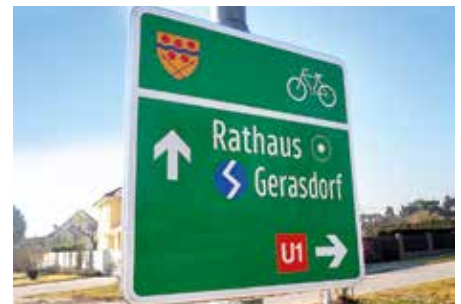
Beschilderung der Radwege