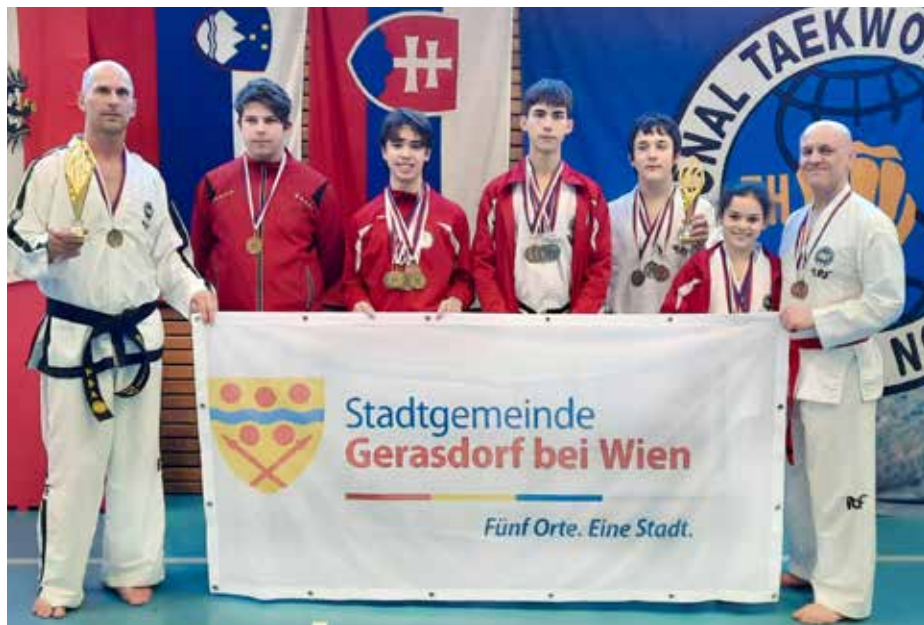
Gratulation an alle Teilnehmer des Gerasdorfer Taekwon-Do Vereins Baekjul-Boolgool.