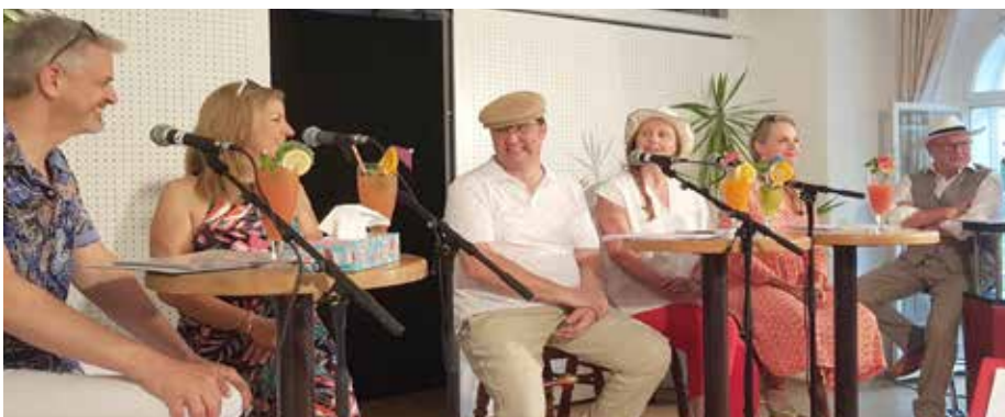
Das ensemble x21 mit der Liedrevue „Sommerfrisch und munter“

■ 30. Juli, 19:30 Uhr LITERARISCHE LIEDREVUE – Sommerfrisch und munter; KuZ Schloss Seyring/Schlosspark