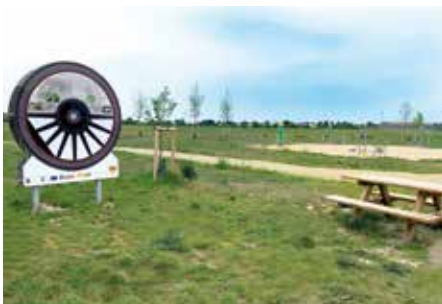
Radweg Dampfross & Drahtesel: Stopp "Badeteich"