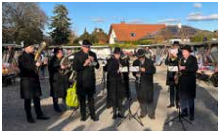
1. GMV eröffneten den Adventmarkt Oberlisse