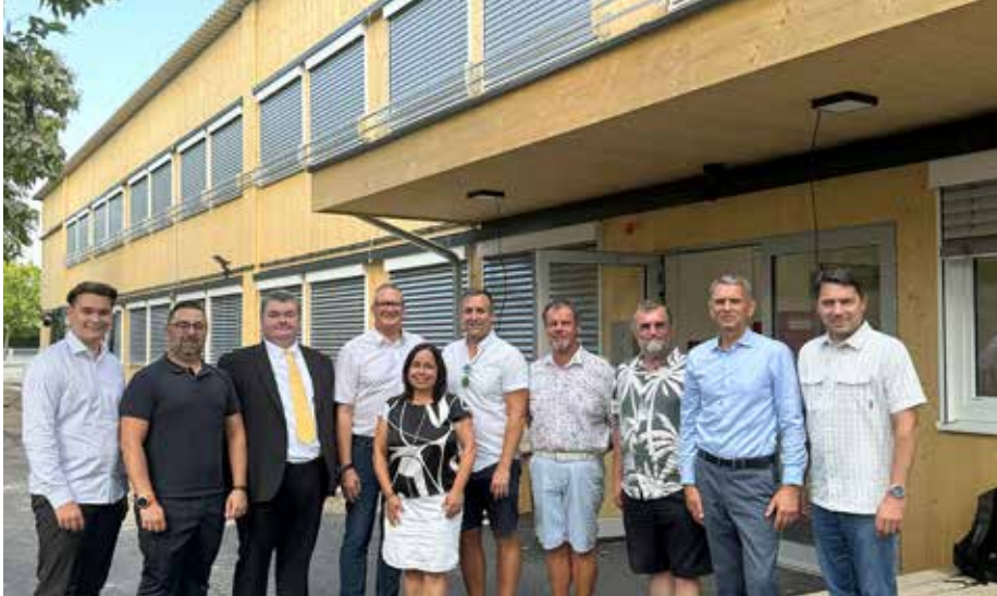
Schulbeginn im GYMNASIUM GERASDORF: 3 Klassen starteten am 2. September 2024 in das erste Schuljahr.

Gemeindeprojekte | Trotz Pandemie wurde in den letzten 5 Jahren vieles erfolgreich umgesetzt.