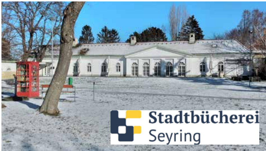
Die Stadtbücherei Seyring befindet sich im Kulturzentrum im Schloss Seyring

■ Gemeinsam auf Reisen in andere Welten gehen! Die Bücherei gewährleistet seit vielen Jahren den freien Zugang zu Wissen, kulturellen Aktivitäten und kreativem Denken – denn: Bildung, Wissen und Kultur sind das Kapital für unsere Zukunft. Daher ist es uns besonders wichtig, durch ein reichhaltiges, abwechslungsreiches und aktuelles Angebot ständig für das Lesen zu werben!