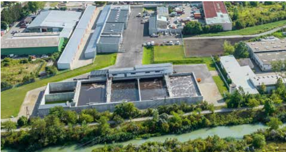
Gerasdorfer Jahrhundertprojekt: KLÄRANLAGE UND WIRTSCHAFTSHOF