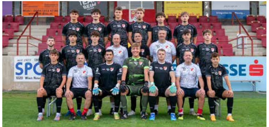
Mannschaftsfoto U23 SV Gerasdorf/Stammersdorf

■ Die U23 des SV Gerasdorf/Stammersdorf beendete die Herbstsaison als Tabellenführer in der Wiener Stadtliga Reserve.