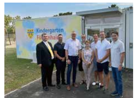
KINDERGARTEN FÖHRENHAIN wurde im Herbst 2024 eröffnet