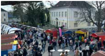
Ostermarkt vor dem Rathaus 2024

■ Kunsth Handwerk & österliche Geschenkkideen: Haben Sie Interesse als Marktstandler*in teilzunehmen, wenden Sie sich bitte an oeffentlichkeitsarbeit@gerasdorf-wien.gv.at .