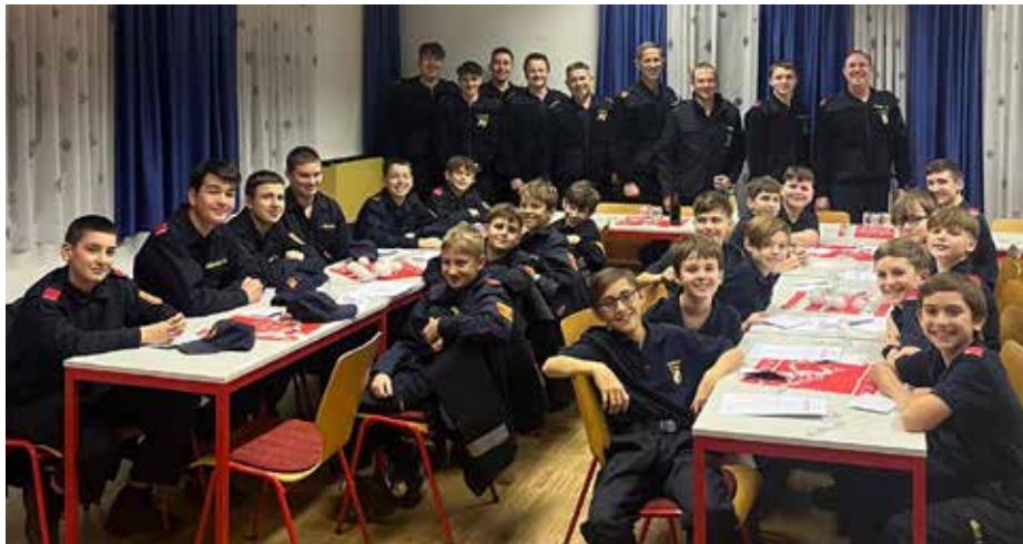
Feuerwehrjugend 2024

■ Die gemeinsame Weihnachtsfeier der Feuerwehrjugend der FF Gerasdorf und FF Seyring fand heuer im Feuerwehrhaus Gerasdorf statt.