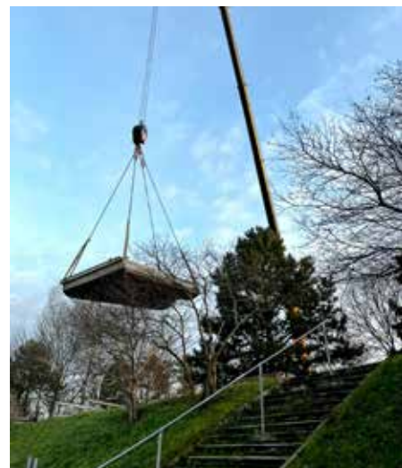
Die Schwimmkörper mussten mit einem Kran aus dem Wasser gehoben werden.

■ In weiterer Folge werden die Einzelteile nun gereinigt, nötige Arbeiten an der Dichtheit der Aluminiumhülle durchgeführt und rechtzeitig bis zur nächsten Badesaison wieder zu Wasser gelassen.