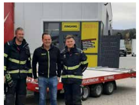
Kameraden der FF Seyring bei der Abholung des Bergeanhängers

■ Der neue Bergeanhänger ersetzt die bisher genutzte Abschleppachse und wurde aus den Eigenmitteln der Feuerwehr finanziert. Die Anschaffung unterstreicht die Bedeutung moderner Ausrüstung im Feuerwehrwesen.