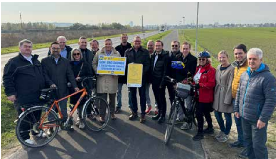
Erweiterung des Radwege-Netzes: Im Herbst 2024 wurde der RADWEG NACH LEOPOLDAU offiziell eröffnet.

■ Die letzte Gemeinderatswahl fand vor 5 Jahren, auf den Tag genau ebenfalls am 26. Jänner 2020 statt. Kurze Zeit später, am 16. März 2020 begann der erste Corona-Lockdown. Die folgenden 2 Jahre waren geprägt von Ausgangsbeschränkungen, Abstandsregeln, Testungen und Impfungen. Die Stadtgemeinde reagierte souverän auf die Herausforderungen der Corona-Krise.