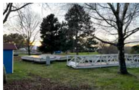
Generalüberholung der Schwimmkörper & Stege