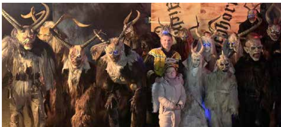
Feuerwehrpunsch mit Perchtenshow am 7. Dezember 2024 war ein großer Erfolg

■ Der Feuerwehrpunsch mit Perchtenshow der Freiwilligen Feuerwehr Gerasdorf war wieder ein voller Erfolg. Über 700 begeisterte Zuschauer*innen folgten dem Spektakel der Aichhorn-Teifln. Neben köstlichem Punsch und erfrischenden Kalt-getränken gab es für die Gäste auch Hot Dogs. Nach