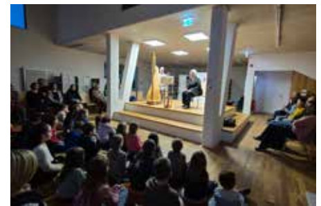
Märchenerzählerin Sonja Schodl und Harfenist Willi Tucek

■ Auch 2025 freuen sich die ehrenamtlichen Mitarbeiter*innen der Stadtbücherei auf Ihren Besuch.