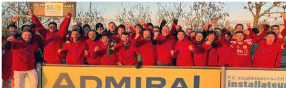
Kampfmannschaft des FC Kapellerfeld feiert ihre Erfolge

■ Die Kampfmannschaft des FC Kapellerfeld konnte in überragender Manier den Titel Herbstmeister erringen.