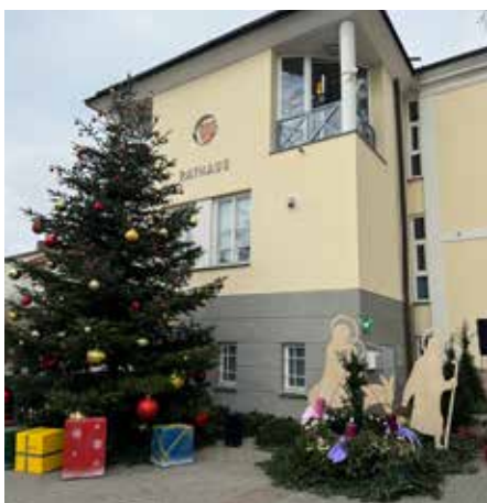
Weihnachtsbaum vor dem Rathaus