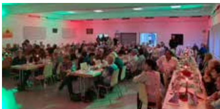
Die Weihnachtsfeier 2024 war sehr gut besucht.

■ Im Dezember erfreuten sich unsere Mitglieder an unserem Adventskalender, hinter dessen Türchen sich kleine Aufmerksamkeiten verbargen, unter anderem Teelichter und Lebkuchen.