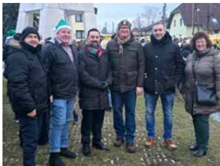
Kapellerfelder Adventmarkt am 14.12.