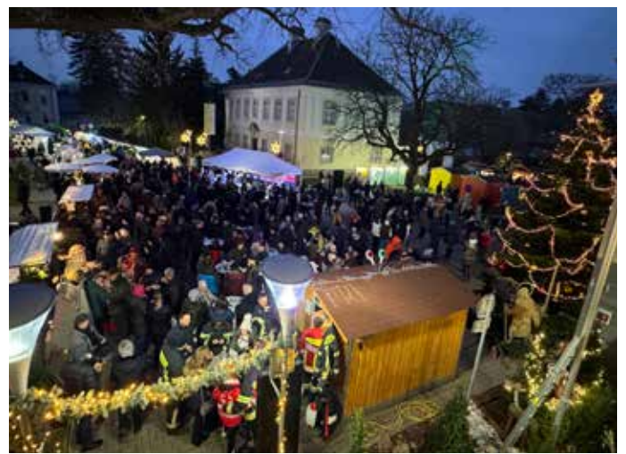
Besucherinnen und Besucher füllten den Rathaus Platz.