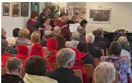
Seyringer Advent am 08.12.2024 im Schloss: Eröffnung mit dem Chor FARA NUME