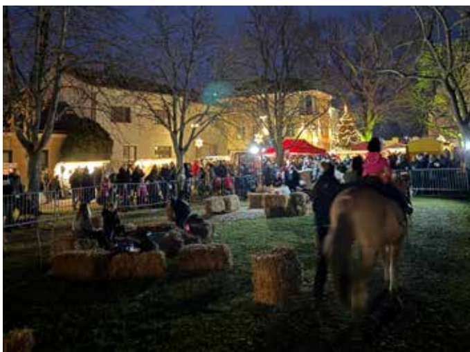
Ponyreiten vor dem Rathaus